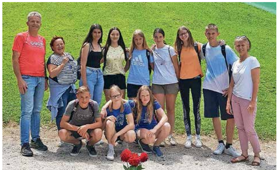
Najuspešnejši devetošolci na izletu z županom