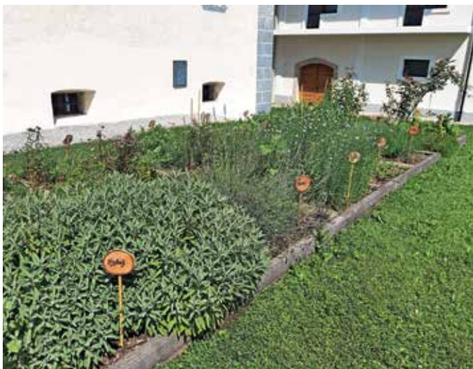
Zeliščni vrt ob Dvorcu Visoko

Pred časom sem uspešno sodelovala na vseslovenskem natečaju za najbolj inovativen, kreativen in funkcionalno urejen vrt.