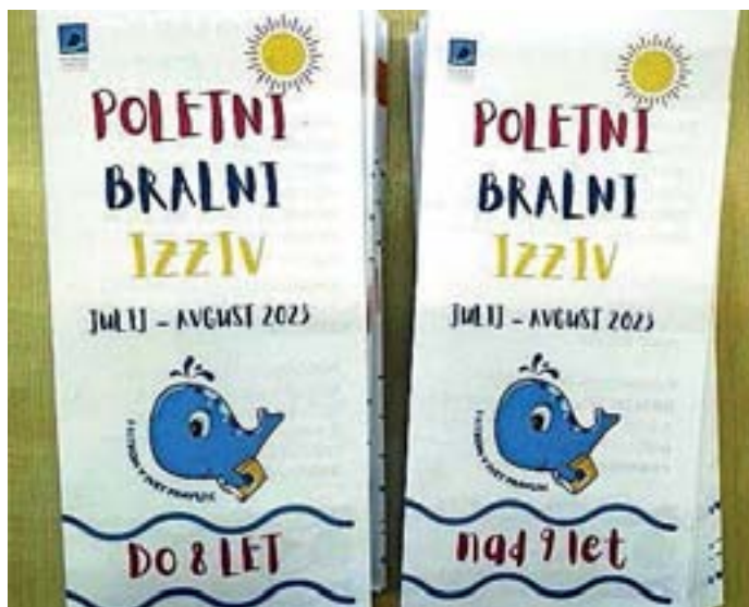
Poletni bralni izziv

Celo poletje, vse do konca septembra, je na ogled razstava V začetku je bila beseda Klekljarskega društva Deteljica Gorenja vas. V našem narodu je bilo rojenih mnogo velikanov, ki so nam zapustili neprecenljivo dediščino v obliki besed. Eden vidnejših je bil tudi naš rojak, dr. Ivan Tavčar, ki mu je ob stoti obletnici smrti posvečeno letošnje leto. Članice društva so upodobile Ivana Tavčarja in nekaj prizorov iz njegovih del. Poleg njega pa še portrete Primoža Trubarja, Franceta Prešerna, Simona Gregorčiča in