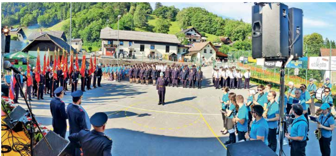
Devetdesetletnico so trebijski gasilci zaznamovali tudi s parado in kulturnim programom.