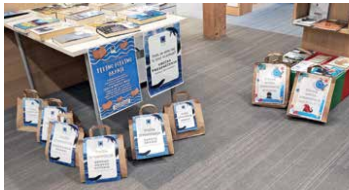
Kitkove vrečke presenečenja