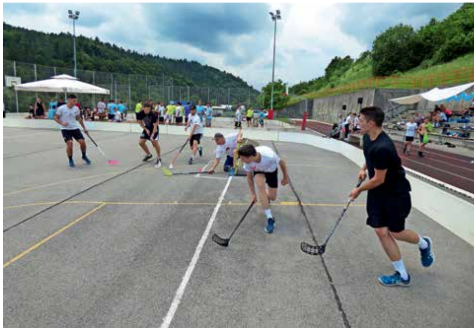
Ves dan so potekali dvoboji ekip na igrišču ob poljanski šoli.

Zmagovalci turnirja so po finalnem obračunu postali člani ekipe K.O.Z.E., na drugo mesto so se uvrstili Štangarji, na tretje pa Sladki carji. Vzporedno je na dodatnem igrišču za floorball potekal Osnovnošolski ŠvicBol, ki je bil sicer planiran za nedeljo 11. junija, a so ga prestavili na soboto, ker so se prijavile samo štiri ekipe. Zmagali so Pokemoni, drugi so bili člani ekipe Loke, tretji pa člani ekipe FBK Žiri 2. Kot del spremljevalnega programa je potekal Beer pong turnir, ki je pritegnil marsikoga. Po