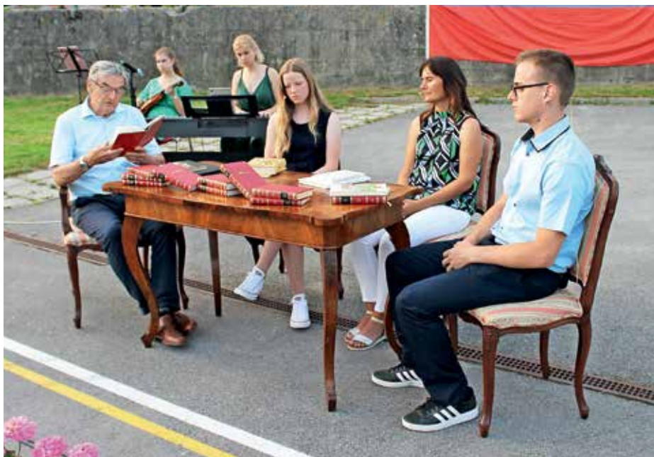
Dan državnosti na Trebiji