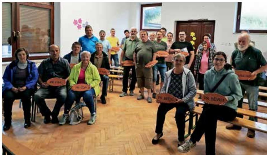
Razdelitev tablic s hišnimi imeni v Leskovici

Letos nadaljujemo popis hišnih imen na območju vasi Kopačnica, Robidnica, Krnice pri Novakih, Laze in Lajše. Ob zaključku popisa bodo zainteresirani lastniki hiš, tako kot v prejšnjih popisih, prejeli tudi glinene tablice z napisom hišnega imena v narečju, vsi zbrani podatki bodo