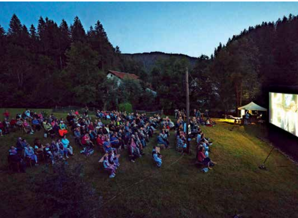
V Luši, pri Kovkarjevi domačiji, so na velikem platnu predvajali film Cvetje v jeseni.