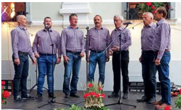
Pevci Vokalne skupine Zala

Pred Dvorcem Visoko je konec junija potekal že tradicionalni Pevski večer.