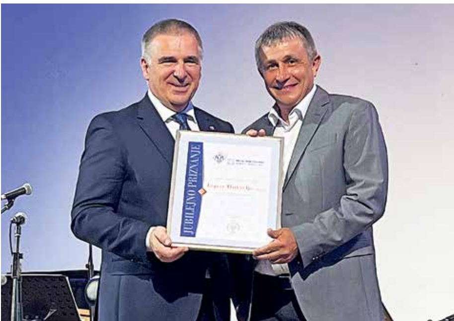
Trideset let že dejavnost opravljajo tudi v podjetju Topos Hotavlje.

Kot zanimivost: Konec junija je bilo v občini Gorenja vas - Poljane registriranih 428 samostojnih podjetnikov, 156 družb z omejeno odgovornostjo ter 60 dopolnilnih dejavnosti na kmetiji.