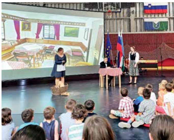
Zaključna prireditev