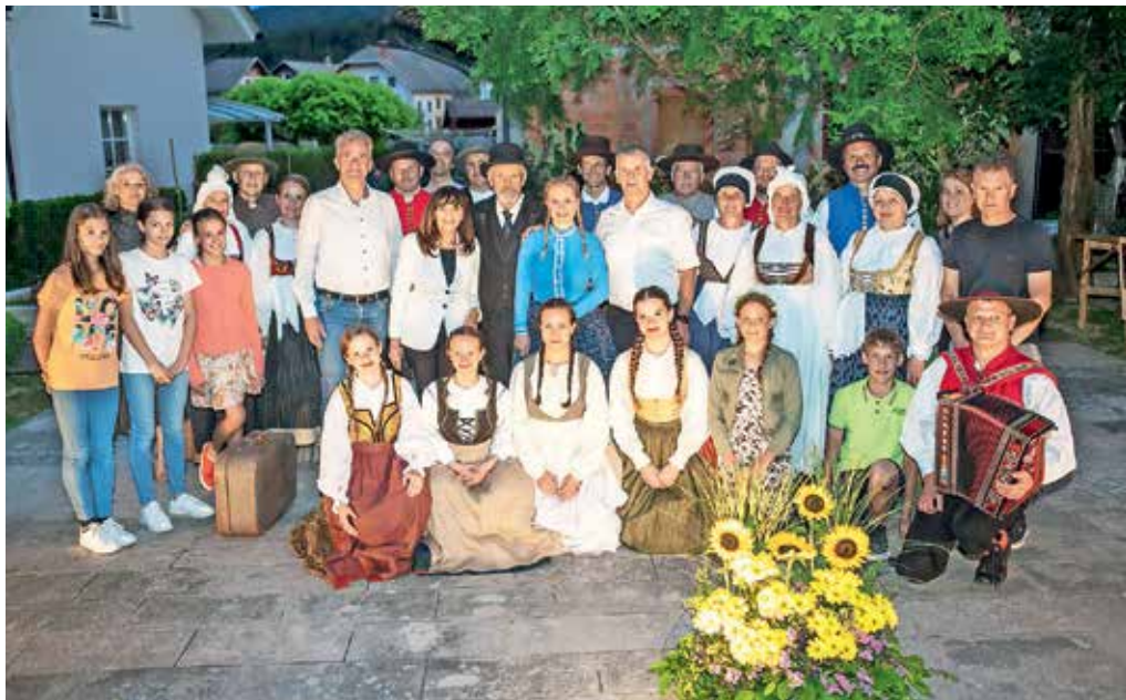
Sodelujoči v kulturnem programu ob dnevu državnosti v Gorenji vasi