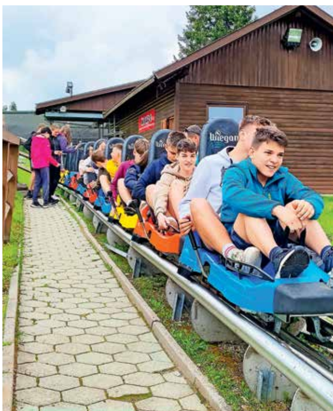
Devetošolci v zadnji šoli v naravi na Rogli