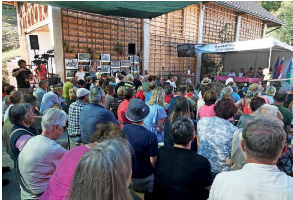
Na Jejlarjevi domačiji so obujali spomine na dneve snemanja filma Cvetje v jeseni.

Preprosto kmečko dekle, ki je življenje živelo tako, kot so ga nekdanj vsa kmečka dekleta, se zaljubi v Janeza, ki na kmete pride na dopust in oddih. Ljubezen kljub