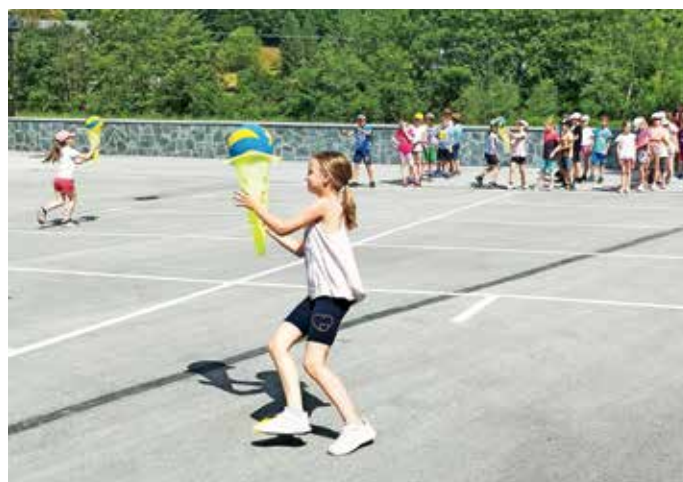
V juniju je v šoli že vladalo bolj sproščeno vzdušje.