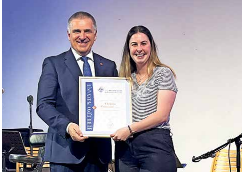
Priznanje za trideset let delovanja je prejelo podjetje Elektro Primožič elektroinštalacije.