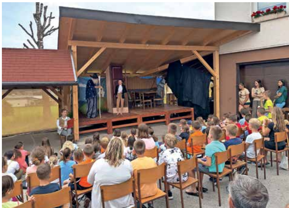
Otroci in starši so si na odru pred župniščem na Trati pozorno ogledali oratorijsko igr o Hobitu.