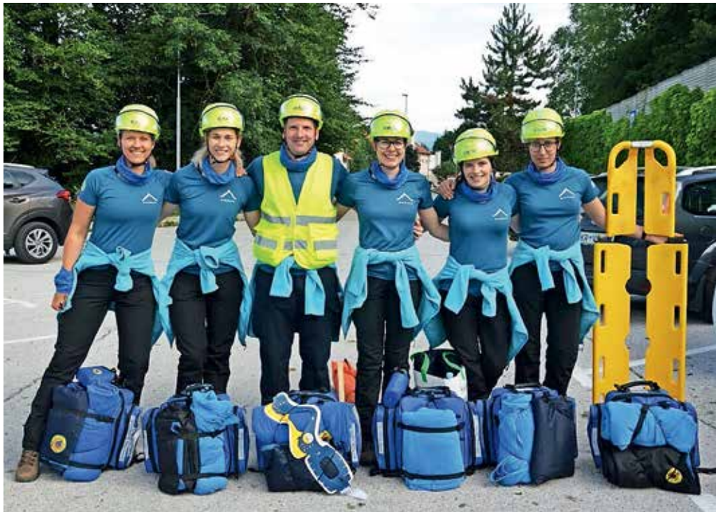
Ekipa prve pomoči Civilne zaščite Občine Gorenja vas - Poljane je bila najboljša na regijskem tekmovanju.

Seveda si člani naše ekipe prve pomoči, ki je usposobljena za reševanje v prime-