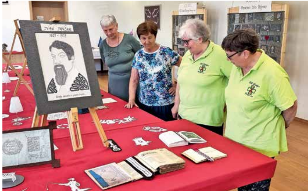
Klekljarsko društvo Deteljica Gorenja vas je pripravilo razstavo z naslovom V začetku je bila beseda, ki si jo je zdaj mogoče ogledati v knjižnici.