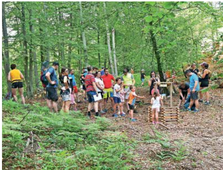
Otroci so nad Čarobnim gozdom in vsemi razpoložljivimi aktivnostmi izjemno navdušeni.

»V vrtcu smo postali že čisto pravi eko detektivi, saj naravo čuvamo, se od nje učimo in jo imamo radi!« Otroci so nad Čarobnim gozdom in vsemi razpoložljivimi aktivnostmi izjemno navdušeni. »Zelo smo presenečeni, kaj vse se lahko v gozdu ustvari iz naravnih materialov! Kako drevo ali kamen postane nekaj zanimivega in posebnega, ko mu je dodan le majhen detajl. Otrok sta navdušena, tako da je sprehod skozi Čarobni