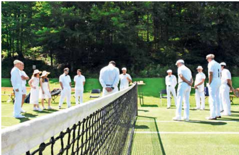
Tenis v belem na travnatem igrišču na Visokem

Igrišče na travi so prvič obudili že leta 2017 ob praznovanju 100-letnice povesti Cvetje v jeseni, ko so prav tako organizirali turnir dvojic v belem, kot so ga pred več kot stotimi leti že igrali na Visokem. »To čudovito igro in igralce v lepih starinskih opravah z lesenimi loparji smo lahko občudovali tudi tokrat,« je dejal župan. Dogajanje prvi dan turnirja je udeležence in obiskovalce vrnilo več kot sto let v zgodovino. Šestnajst igralcev, ki so se pomerili v igri dvojic na travnatem igrišču, med njimi dve ženski, je moralo