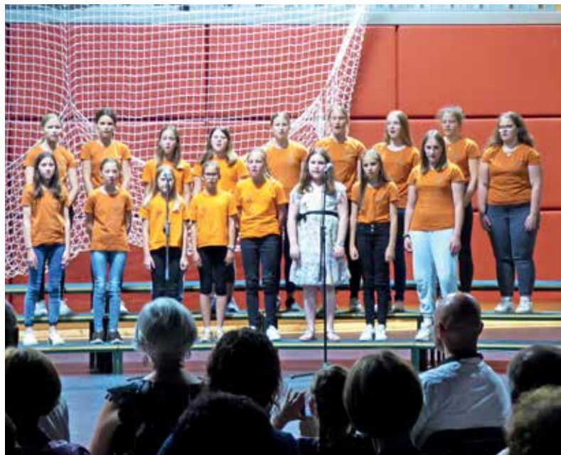
Proslavo ob dnevu državnosti v Poljanah je s svojim nastopom obogatil otroški zbor.