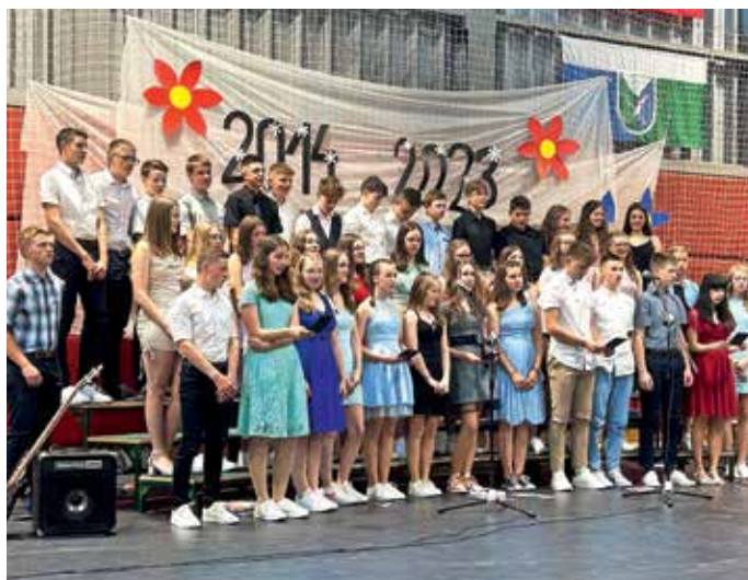
Valetu poljanskih devetošolcev

Vsem učenkam, učencem in vsem bralcem Podblegaških novic želimo lepo in sproščeno poletje!